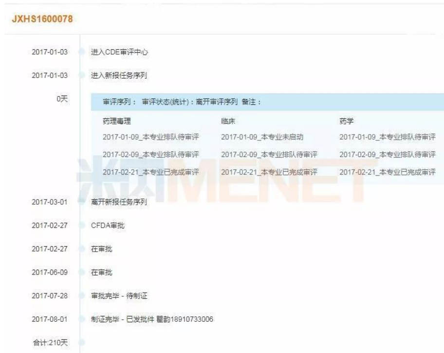
图 6：注射用头孢唑林钠/氯化钠注射液审评时间轴