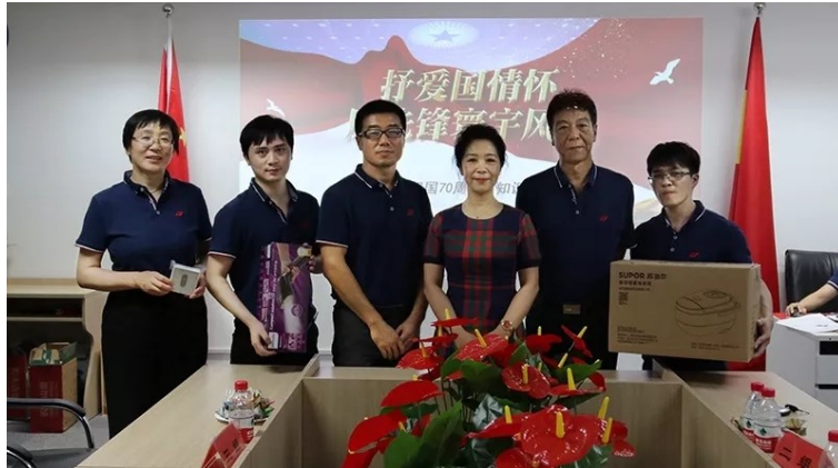
▲竞赛评委为荣获个人一、二、三等奖的员工颁奖