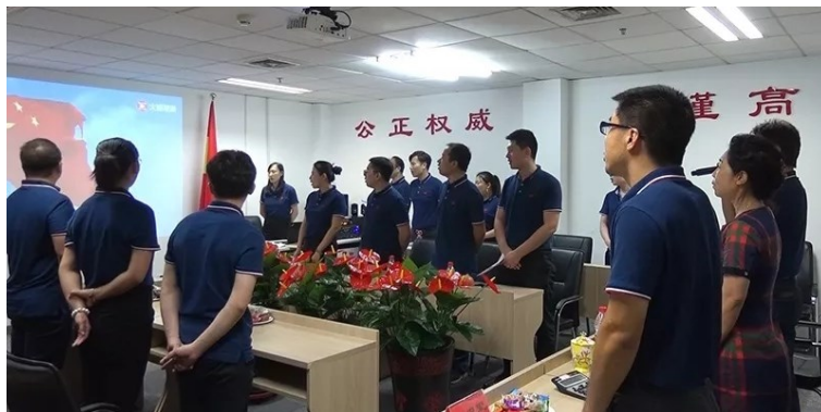
▲先锋寰宇参赛选手高歌《歌唱祖国》，向祖国表达热爱之情

颁奖典礼后，参赛选手高歌《歌唱祖国》，向祖国表达了深沉的热爱之情。在激昂嘹亮的歌声中，先锋人激情满怀、热情高涨。先锋人将继续坚持不忘初心、牢记使命、建功新时代的精神风貌，将“以赛促学、以学促做、融会贯通”的良好氛围持续下去，不断提升政治理论素养、丰富业务知识，立足本职，为先锋寰宇发展作出积极的贡献。