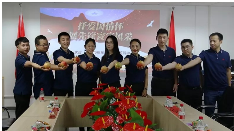
▲参赛选手手捧石榴传递河南分公司的心愿,祝愿国家繁荣昌盛,祝福公司红红火火